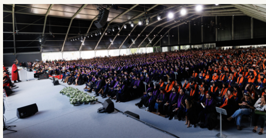
La grande tente montée pour l'occasion sur le campus, qui pouvait accueillir plus de 4000 personnes assises.